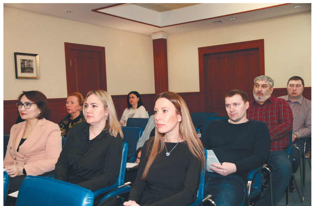
Интерес повышает результат

На семинарах используются самые разнообразные методы: рассматриваются кейсы и практические ситуации, формируются чек-листы, которые можно сразу использовать в своей практической работе, даются ответы на текущие вопросы и возникающие у председателей цехкомов проблемы, используются тестовые методики и работа в группах (например, разработка