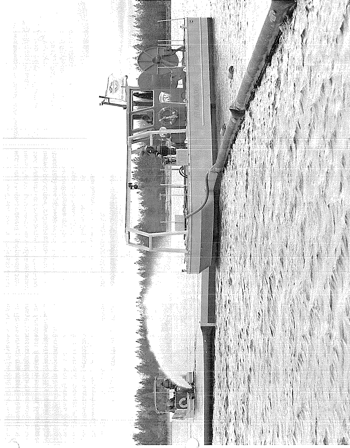
Катер «Цезарь Куников» создаёт направление волны, загоняя предполагаемое нефтяное пятно в установленные границы.

В первый день лета нештатное аварийно-спасательное формирование ПАО «Сургутнефтегаз» провело очередные плановые учения на воде, оттачивая навыки по устранению условного разлива нефтесодержащей жидкости. На выездном мероприятии побывали и корреспонденты «НТ».