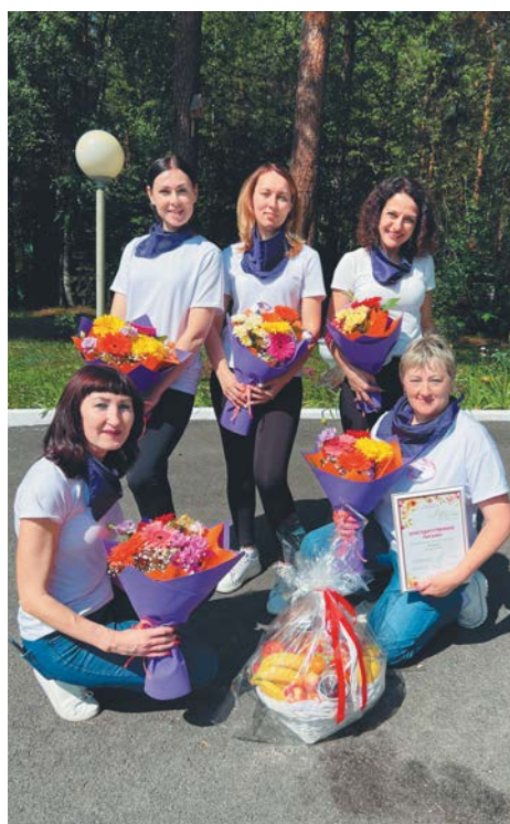
Группа «Лидер» Лянторского ВМУ всегда готова к покорению новых вершин!