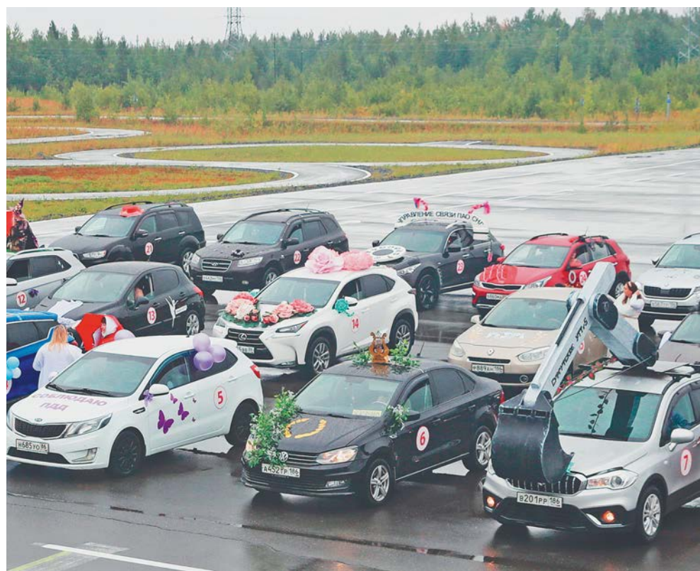
Некоторые участницы придумывают своим «железным коням» ласковые имена: Кирюша, Белочка, Злата, Полик, Ласточка... А как зовут ваше авто?