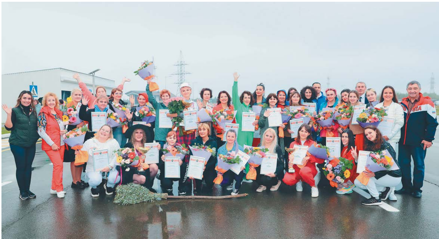
Участницам конкурса удалось сохранить оптимизм и весёлый настрой, несмотря на капризы погоды

Богини, леди в красном, жгучие цыганочки и нежные балерины – финалистки «Автоледи ПАО «Сургутнефтегаз» порадовали жюри и гостей конкурса яркими образами и впечатляющим оформлением машин. Безграничное пространство для полёта фантазии дала тема конкурса: «Грация на дороге». В этом году для участия заявили 59 работниц акционерного общества, до главного испытания дошли 30 конкурсанток, благополучно справившихся с тестом на знание правил дорожного движения. Среди них повезло быть и мне, корреспонденту «НП». Вашему вниманию – репортаж, что называется, из первых уст.